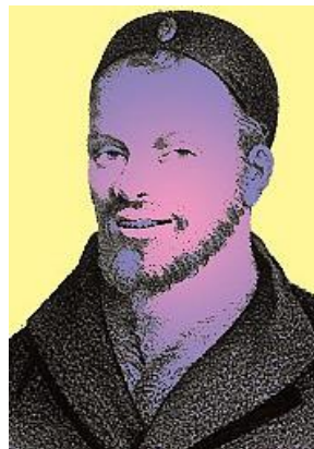
François RABELAIS pseudonyme Alcofribas Nasier auteur humaniste et satirique de Gargantua (1534)