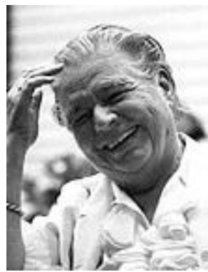
Marguerite YOURCENAR Première élue à l'Académie française en 1980, après Mishima ou la vision du vide