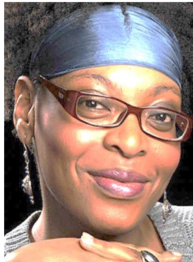
Léonora MIANO Prix Fémina 2013 pour La Saison de l'ombre